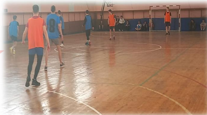
Физическая подготовка и спортивно-массовая работа