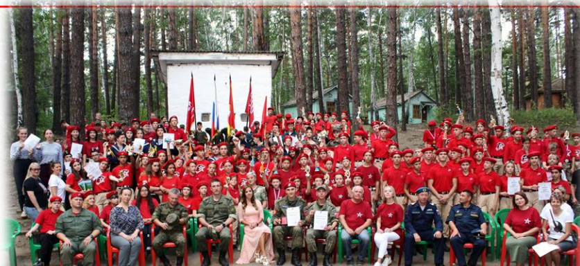
Областная летняя юнармейская смена