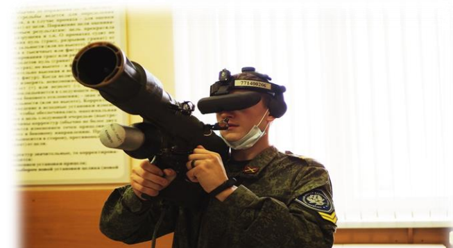
Уничтожение целей из ПЗРК