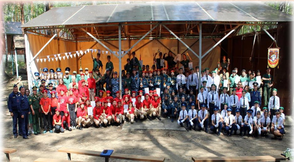
Учебно-тренировочные сборы «Патриот»