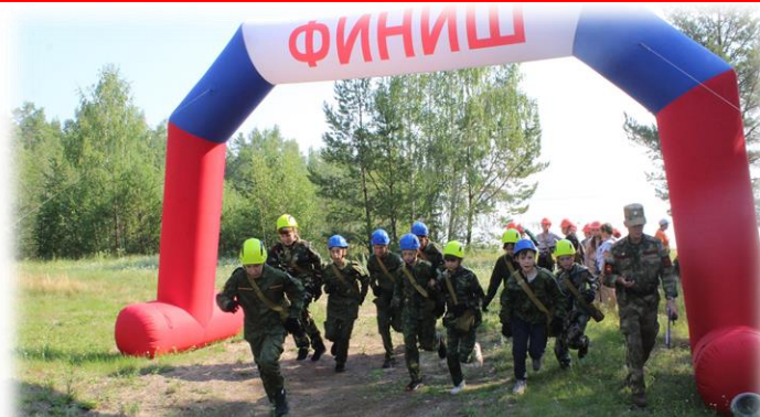
Преодоление воензированной полосы препятствий