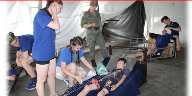
Проведение конкурса «Оказание медицинской помощи»