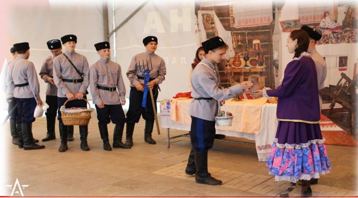
Конкурс «Представление команды»