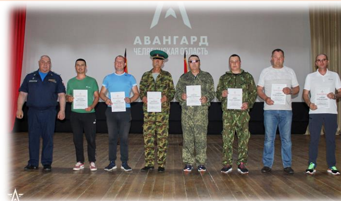
Подведение итогов сборов