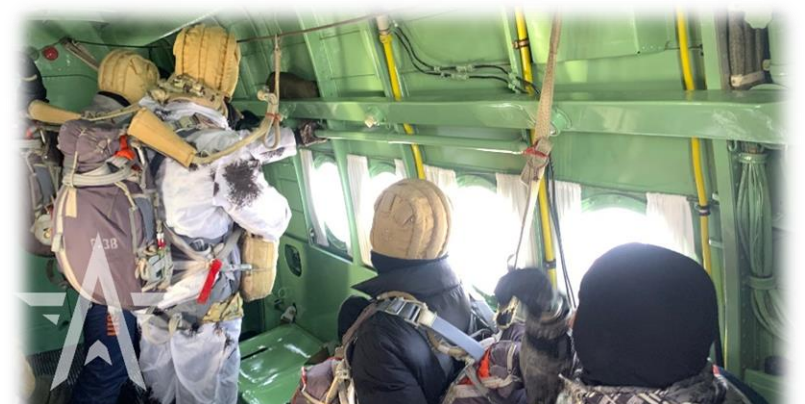
Областные соревнования «Сильные духом»