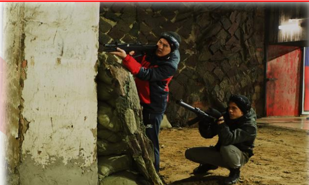
Тактическая игра «Лазертаг»