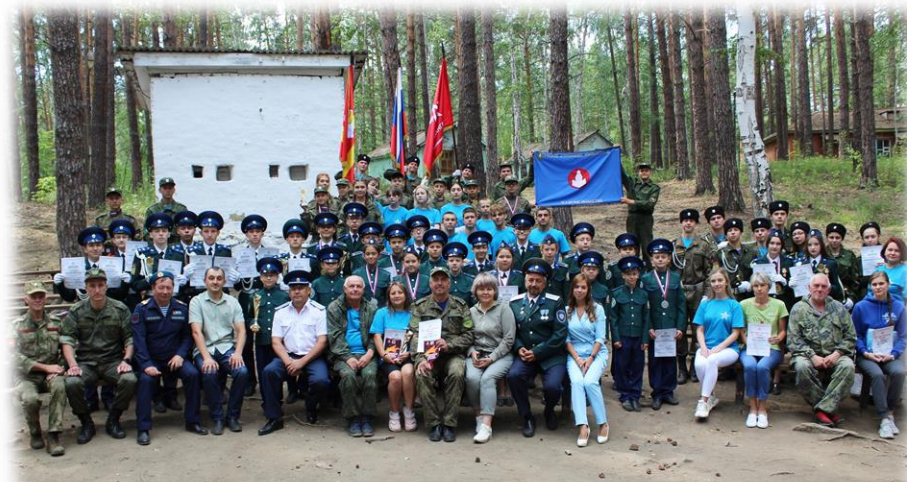
Областной слет казачьих молодежных объединений