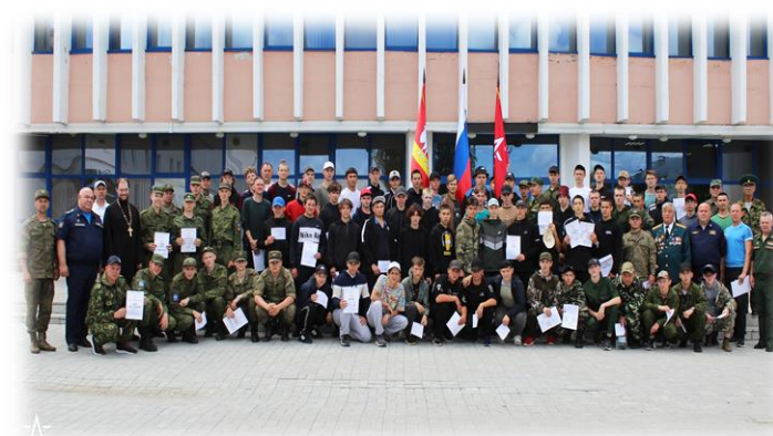
Подведение итогов сборов