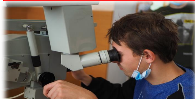
Поражение танков из ПТУР