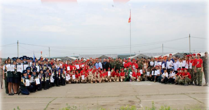
Областные военно-патриотические соревнования «Зарница – во славу Отечества!»