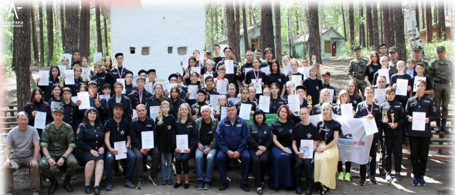
Областной слет поисковых объединений