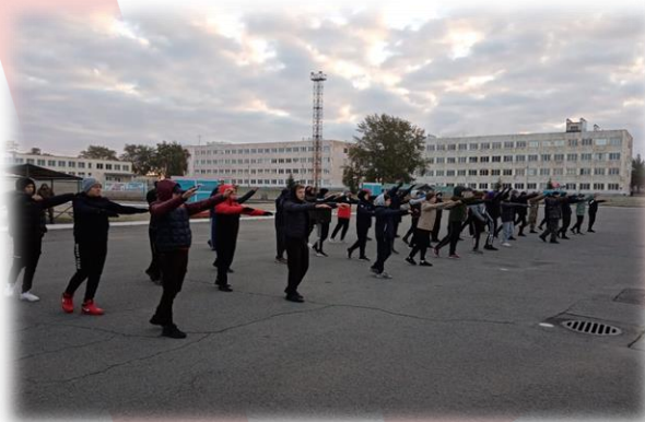
Утренняя физическая зарядка