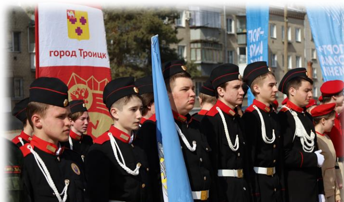
Проведение конкурса «Красив в строю – Силен в бою!»