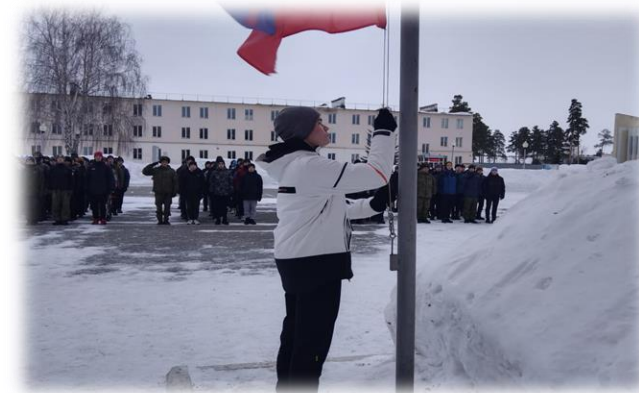
Подъем Государственного Флага