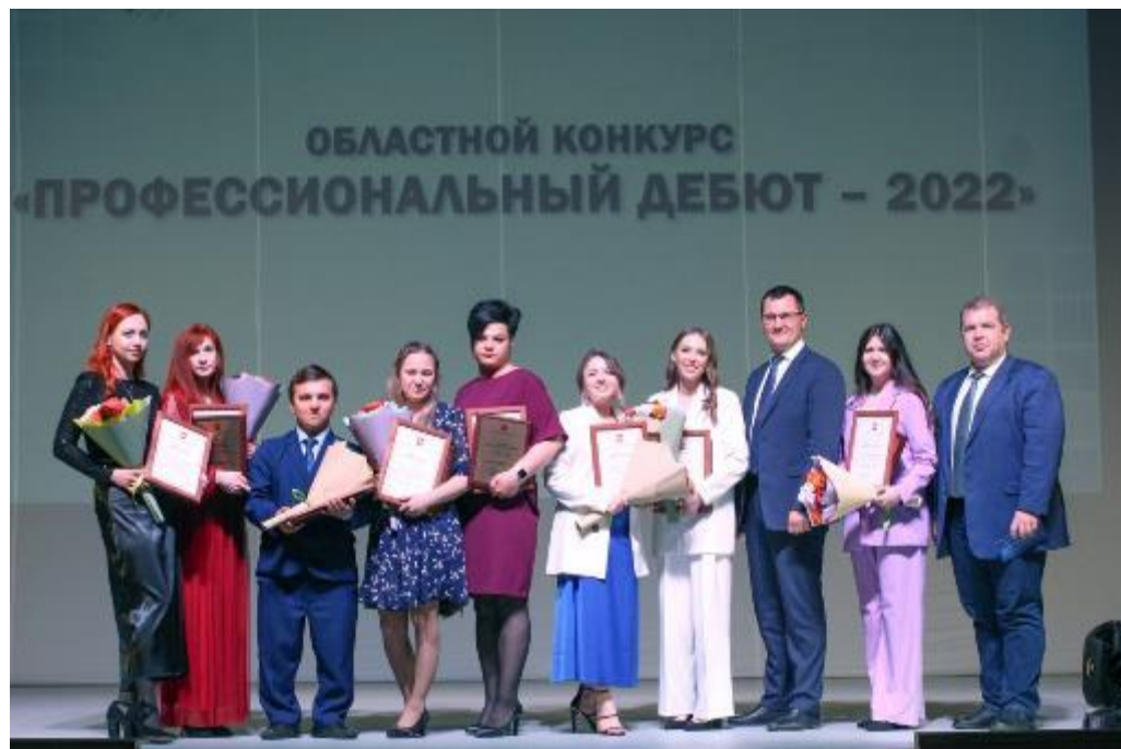
Конкурс профессионального мастерства «Профессиональный дебют»

ВЗАИМОДЕЙСТВИЕ НАЧИНАЮЩЕГО СПЕЦИАЛИСТА С ОПЫТНЫМ И РАСПОЛОГАЮЩИМ РЕСУРСАМИ И НАВЫКАМИ ПЕДАГОГОМ, ОКАЗЫВАЮЩИМ ПЕРВОМУ РАЗНОСТОРОННЮЮ ПОДДЕРЖКУ