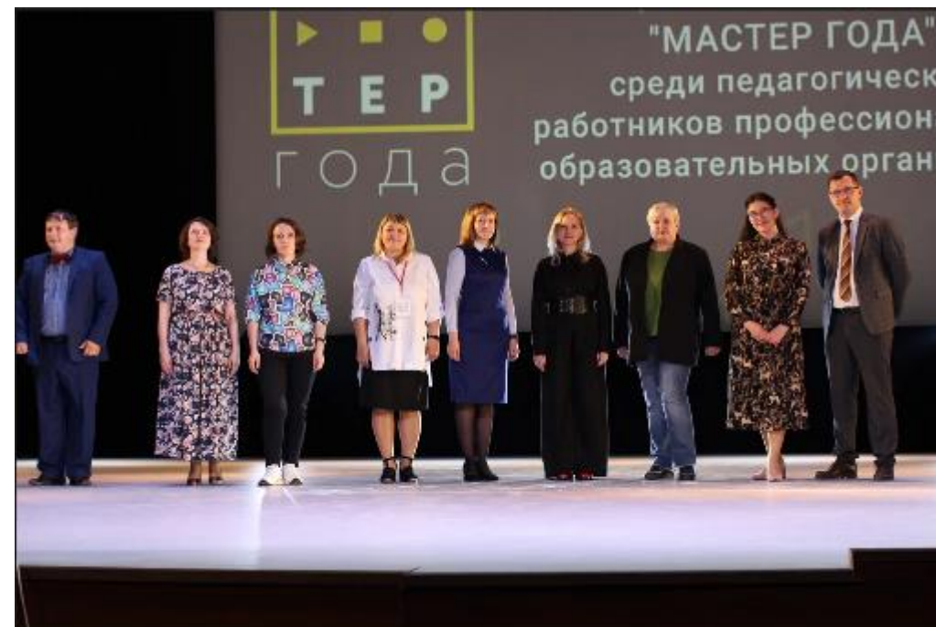
Конкурс профессионального мастерства «Мастер года»